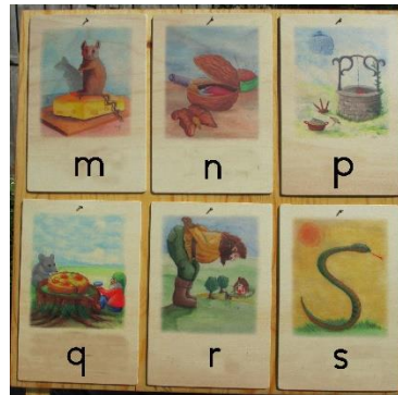
Alleen betreffende klank